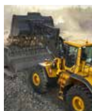
Volvo Construction Equipment