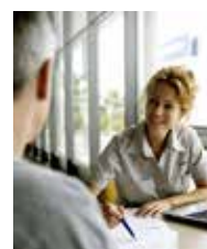
Volvo Financial Services